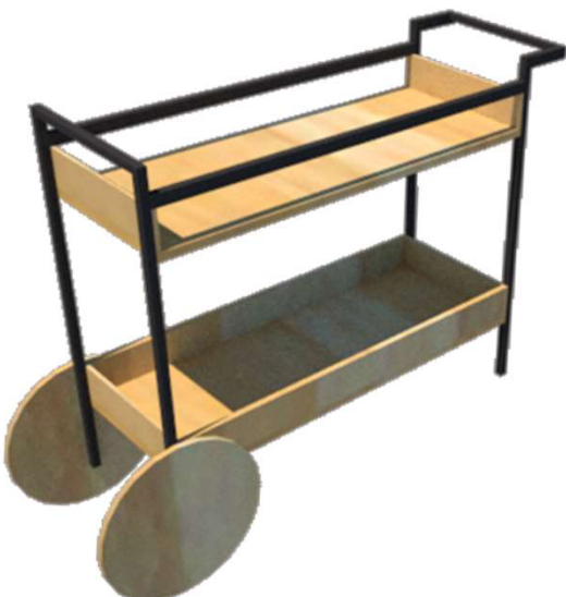
Tabela de Peças

4° Etapa: Colocar 04 Parafusos em cada roda para encaixe na caixa inferior de MDF.