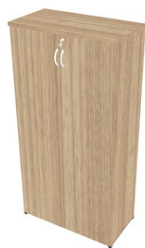
ARMÁRIO ALTO C/ 2 PORTAS NATUS

NATUS 40MM: ARALN4301 MEDIDA: L 800 X P 420 X A 1600 MM