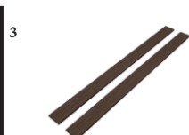
2 Placas MDF Maior Para Parte Frontal