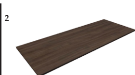
1 Tampo MDF