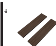
2 Placas MDF Menor Para As Laterais