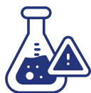
ÁCIDOS E PRODUTOS QUÍMICOS

ÁCIDOS E PRODUTOS QUÍMICOS PARA PISCINA, ÁCIDO DE BATERIA, ÁCIDO MURIÁTICO, REMOVEDORES DE TINTAS E SIMILARES DANIFICAM A SUPERFÍCIE DO AÇO INOX E PORTANTO DEVEM SER EVITADOS.