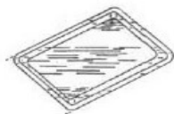
Código 118102 Bandeja