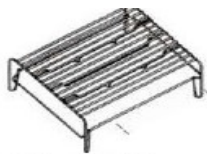
Código 118101 Grelha Metálica