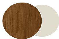
JEQUITIBÁ / OFF