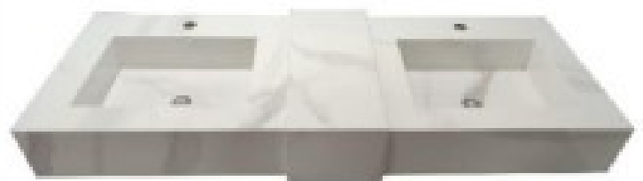
IMAGEM N° 4