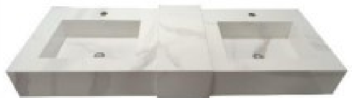
IMAGEM N° 4