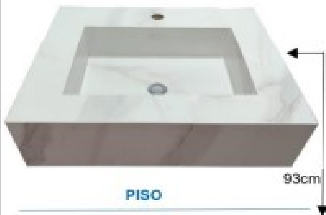
IMAGEM N° 1