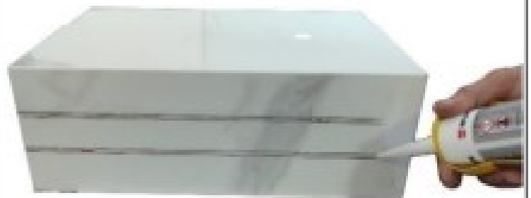
IMAGEM N° 2