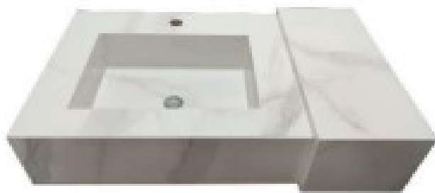
IMAGEM N° 3