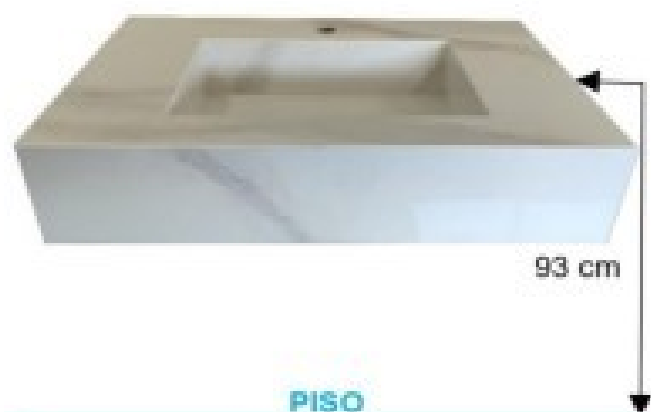
IMAGEM N° 1