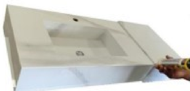
IMAGEM N° 3