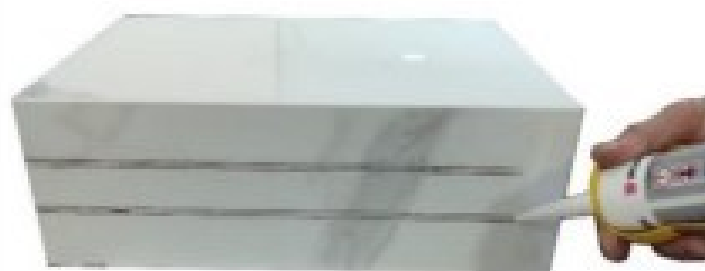
IMAGEM N° 2