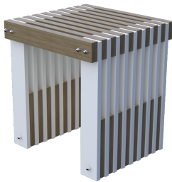
BANCO RIPADO 40 ZOE CÓDIGO: BAN025