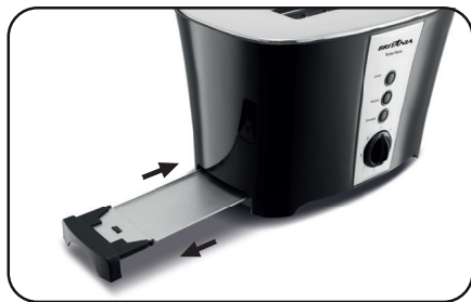
FIGURA 4 - Removendo o coletor de migalhas.