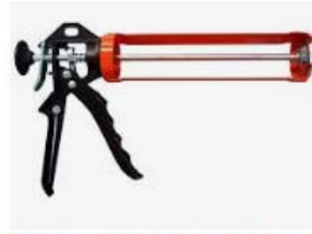
Pistola aplicadora de Silicone