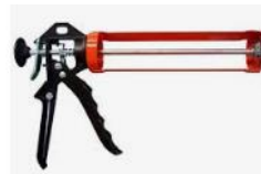
Pistola aplicadora de Silicone