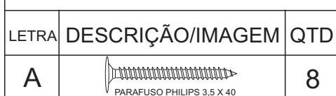
TABELA DE FERRAGEM