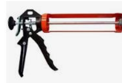
Pistola aplicadora de Silicone