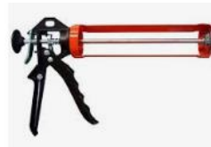
Pistola aplicadora de Silicone