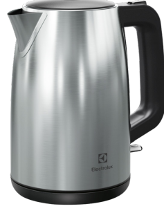
Fotos e desenhos ilustrativos. Chaleira elétrica EEK25, PORT, REV00