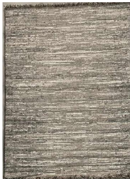
Ref. 2J BEGE