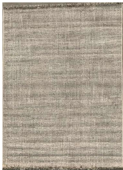
Ref. 80H BEGE CINZA