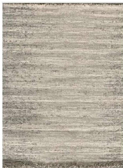
Ref. 2E CINZA CLARO