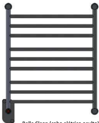
Belle Clean (cabo elétrico oculto)