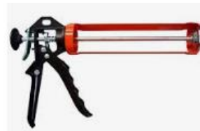
Pistola aplicadora de Silicone