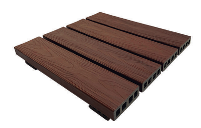
Deck modular 43x43cm