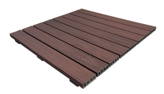
Deck modular 86x86cm

Deck modular sobre terra: nesta modalidade de instalação o terreno deve estar nivelado para realizar a instalação, ou seja, se houver desnível em função da erosão do solo, o deck modular irá acompanhar este desnível.