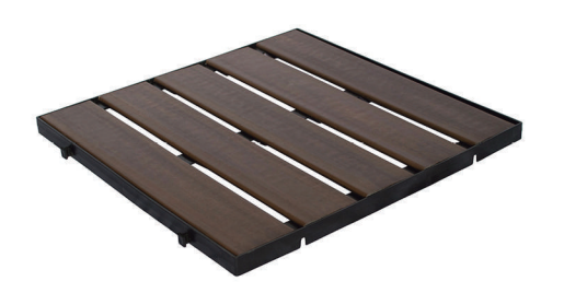
Deck injetado 50x50cm

Deck modular sobre elevação: nesta modalidade de instalação a estrutura embaixo do deck modular deve respeitar o distanciamento de vão livre de 30cm, caso não seja respeitada, haverá empenamento do deck modular.