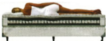
Áreas de maior pressão do corpo

Durante o processo de fechamento do colchão, a capa fica tensionada devido à elasticidade da espuma e do tecido. Com o uso, poderá ocorrer um laceamento, ocasionando uma aparência de tecido solto. Esta é uma situação normal.