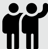
4 - Uma pessoa para ajudá-lo

Obs.: As buchas e parafusos necessárias para a fixação na parede já estão inclusas nas ferragens do produto. Você não precisa comprá-las. Cuba, torneiras, válvulas e materiais para instalação desses componentes não estão inclusos.