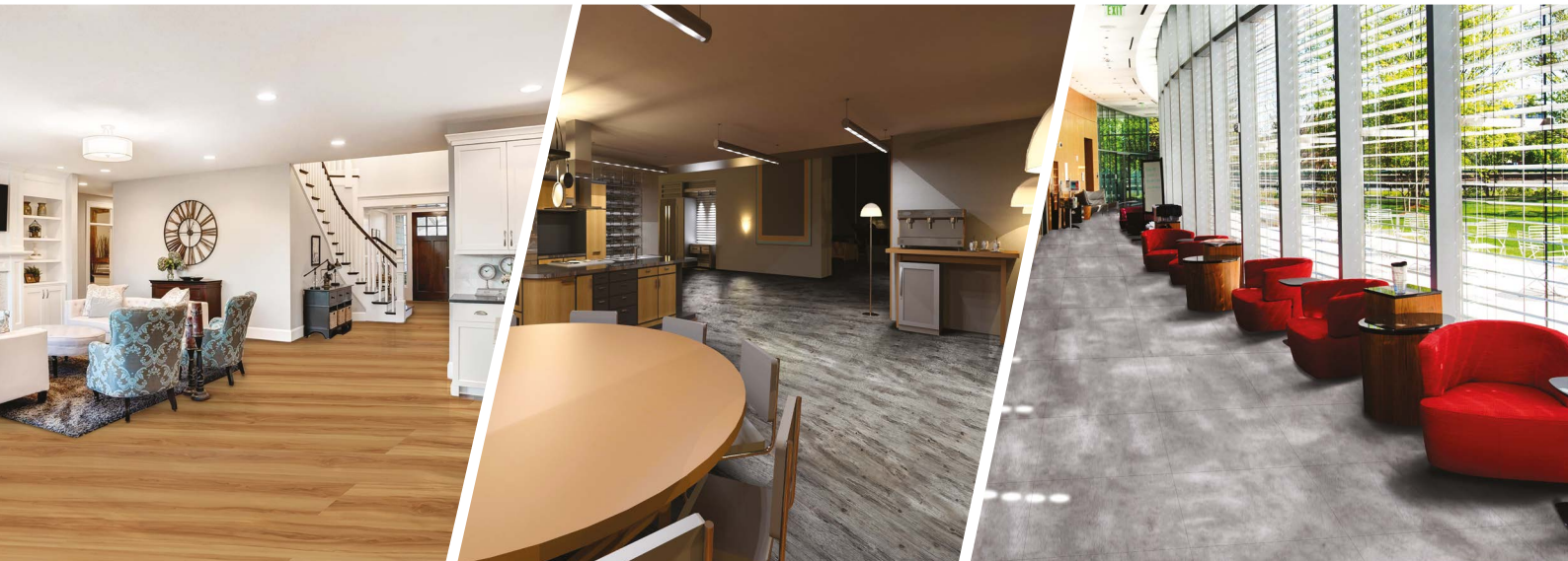
Coleção Cities 2mm