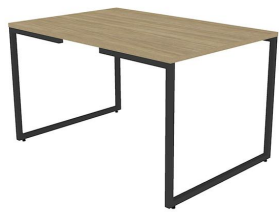
MESA DE JANTAR CORP 25