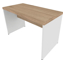
MESA RETA CORP 25MM