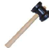
Martelo de Borracha