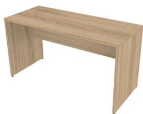
MESA RETA KITCUBOS