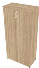
ARMÁRIO ALTO C/ 2 PORTAS NATUS 30 / 40 MM

CÓDIGO: ARALN3301 / ARALN4301 MEDIDA: L 800 X P 420 X A 1600 MM