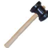
Martelo de Borracha