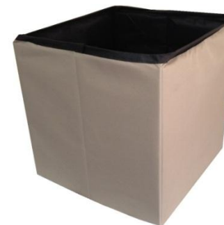
Peça B – Baú montado