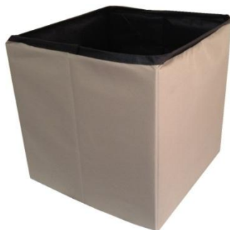
Peça B – Baú montado