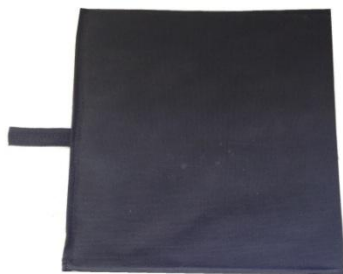
Peça C - Fundo