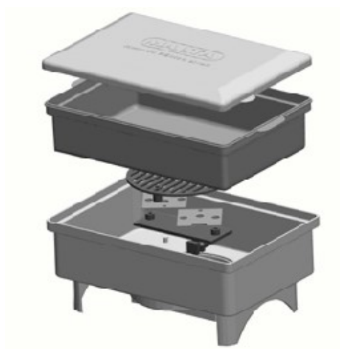
Marmita elétrica retangular 708