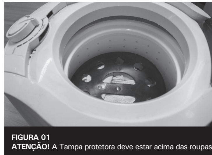
FIGURA 01 ATENÇÃO! A Tampa protetora deve estar acima das roupas.