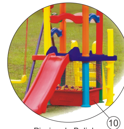
Piscina de Bolinhas (opcional)