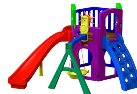
Módulos A + B