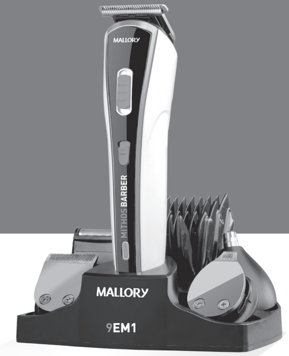
APARADOR DE PELOS