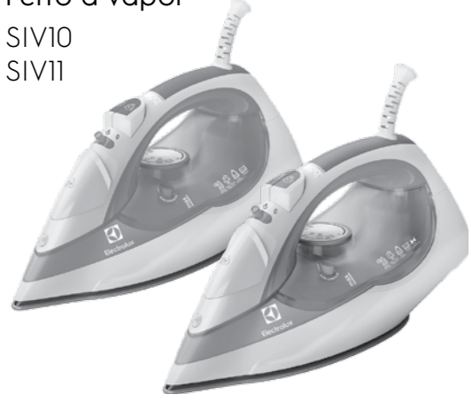
Fotos e desenhos ilustrativos IFU_SIV10_11_POR_REV02